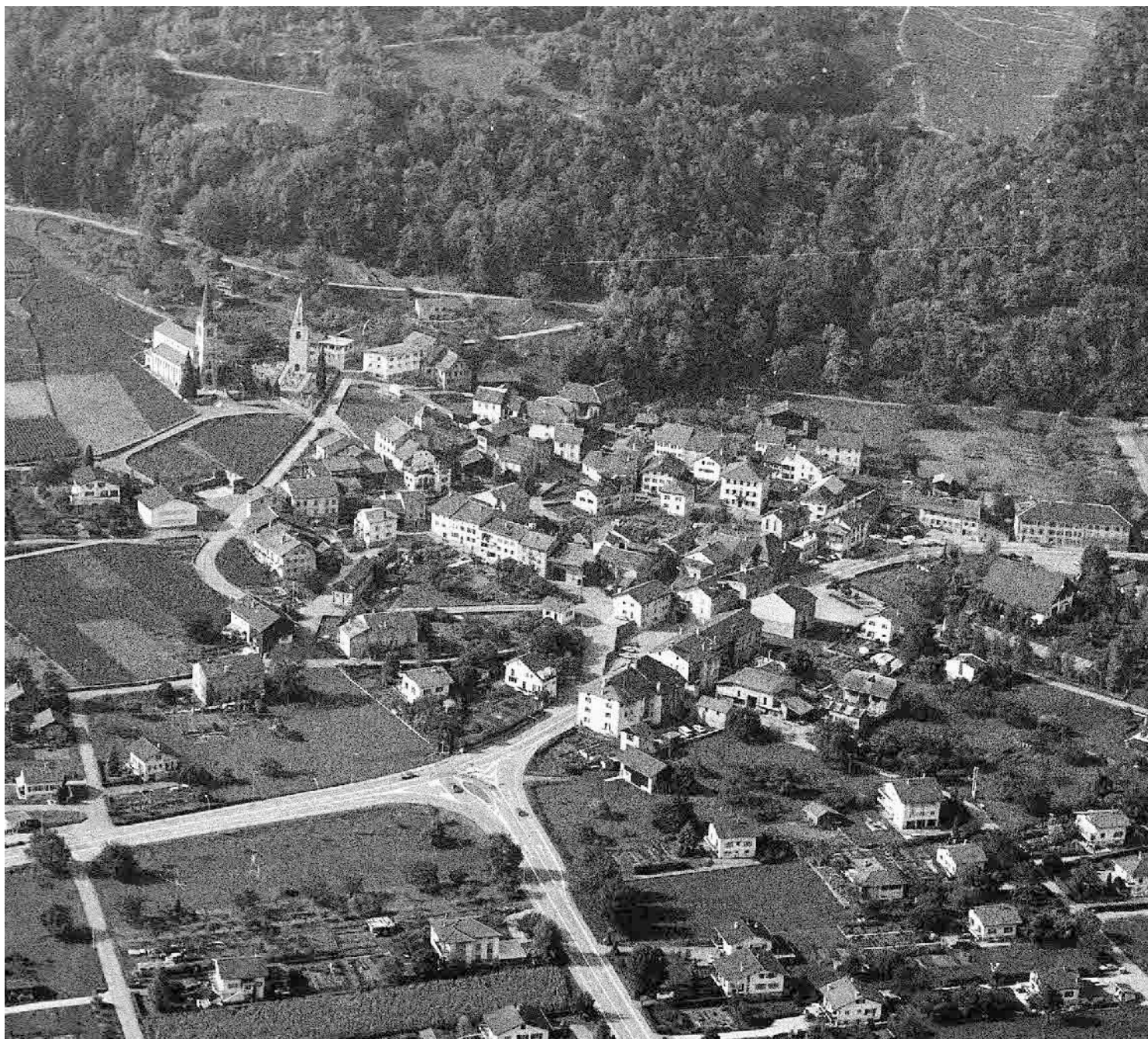
Photo aérienne Charles-André Meyer 1985, © SAT, canton du Valais, Sion

Implanté sur un cône alluvionnaire marqué, le site se caractérise par une structure en éventail, englobant de nombreux espaces libres. A deux sanctuaires en surplomb, une maison forte et un type original de grange néo-classique répond une extension du 19 e siècle le long de la grand-route.