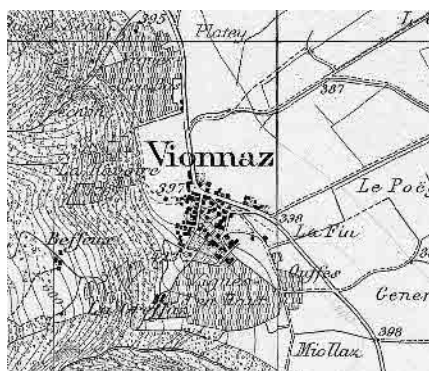
Carte Siegfried 1895

Implanté sur un cône alluvionnaire marqué, le site se caractérise par une structure en éventail, englobant de nombreux espaces libres. A deux sanctuaires en surplomb, une maison forte et un type original de grange néo-classique répond une extension du 19 e siècle le long de la grand-route.