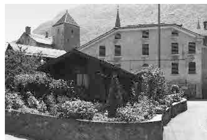
8 Grange datée 1889