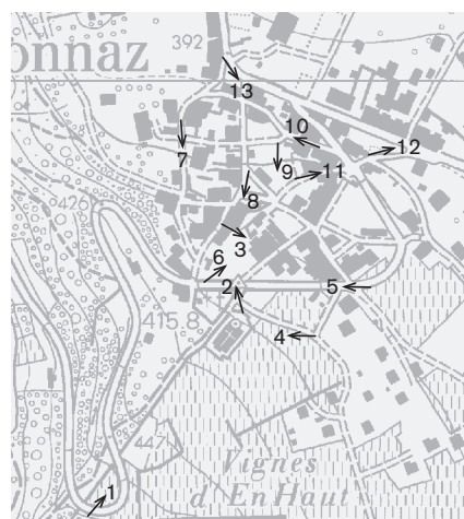
Direction des prises de vue 1:8000 Photographies 1998 : 1-13