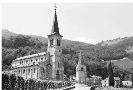
4 Eglise néo-gothique, 1902