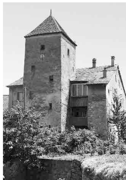
3 Maison Barberini, datée 1613