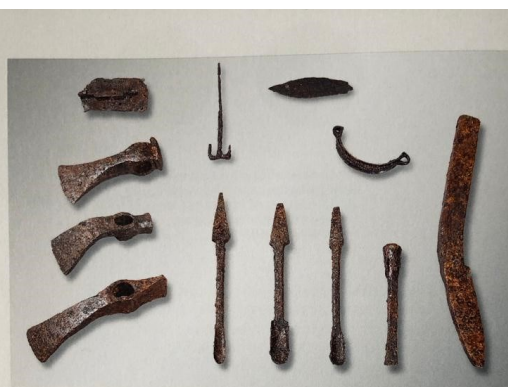
138 Outils et divers ustensiles domestiques ou agricoles en fer découverts ensemble sur le site de hauteur du Cornillon, au-dessus de Vionnaz (VS). Ils ont vraisemblablement été déposés en même temps, peut-être dans une caisse en bois, 4 e -5 e s. MHV Sion.